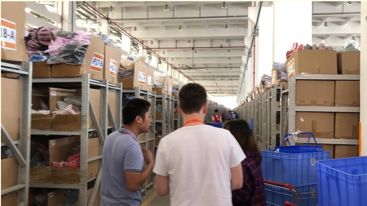
3 WARENLAGER VON GEARBEST

Am liebsten hätte ich die Betreiber der Handelsplattformen selbst befragt und deren Werke besucht. Leider habe ich auf keine meiner Anfragen eine Antwort erhalten. Journalisten des Branchenmagazins ChinaGadgets haben einen der Anbieter vor mehreren Jahren besucht und ein Video auf YouTube veröffentlicht.