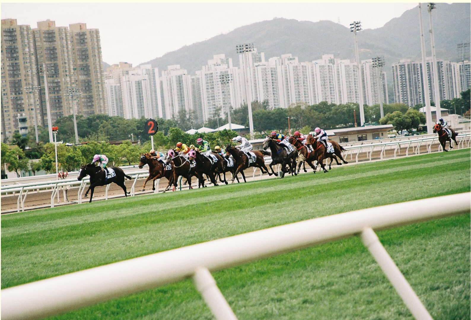
2 EIN PFERDERENNEN AM HONG KONG JOCKEY CLUB - EIN WICHTIGER TREFFPUNKT FÜR DIE HONGKONGER HIGH-SOCIETY

Hongkong folgt bis heute einem frei marktwirtschaftlichen Modell und den Prinzipien des Kapitalismus. Der Staat greift nur minimal in wirtschaftliche Prozesse ein: Es gibt keine Kapitalverkehrskontrollen, niedrige und einfache