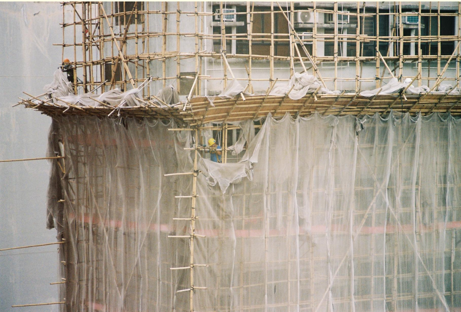
1 BAUARBEITER NEHMEN DIE SICHERHEITSNETZE AB - EINE SOLCHES HATTE IN TAI PO WOHL FEUER GEFANGEN

schwer es ist, in einem solchen System als Journalist zu recherchieren, sollte ich in den kommenden sechs Wochen noch lernen.