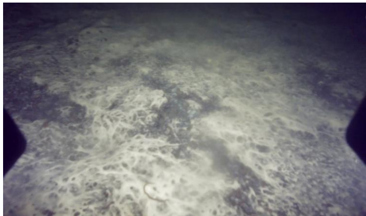
Kontaminierter Boden unter einer Lachszucht.

Das Wachstum der Lachszucht führt zur Überlastung der Fjorde. Seit 2007 häufen sich Umweltkatastrophen, die zeigen, wie stark die Fjorde und Küsten bereits beeinflusst sind. Damals löste das ISA-Virus (Infectious Salmon Anemia) nicht nur eine Gesundheits-, sondern auch eine soziale Krise aus, bei der Tausende ihren Arbeitsplatz verloren. 2016 kam es vor Chiloé zur bislang schwersten