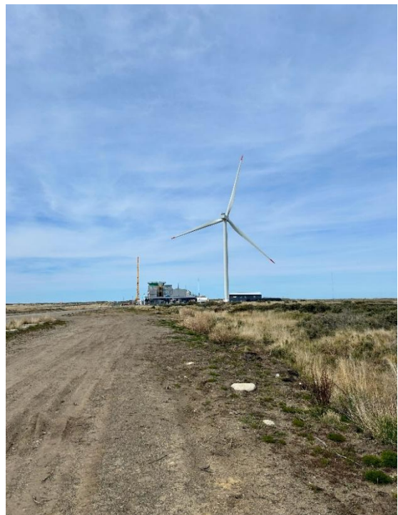
Die Pilotanlage Haru Oni.

Das Unternehmen HIF Global (Highly Innovative Fuels) will mit seiner Pilotanlage Haru Oni in der Nähe von Punta Arenas zeigen, wie Kraftstoffe aus grünem Wasserstoff möglichst umweltverträglich produziert werden können. „Als wir 2014 hierherkamen, wussten wir nicht, was wir mit dem