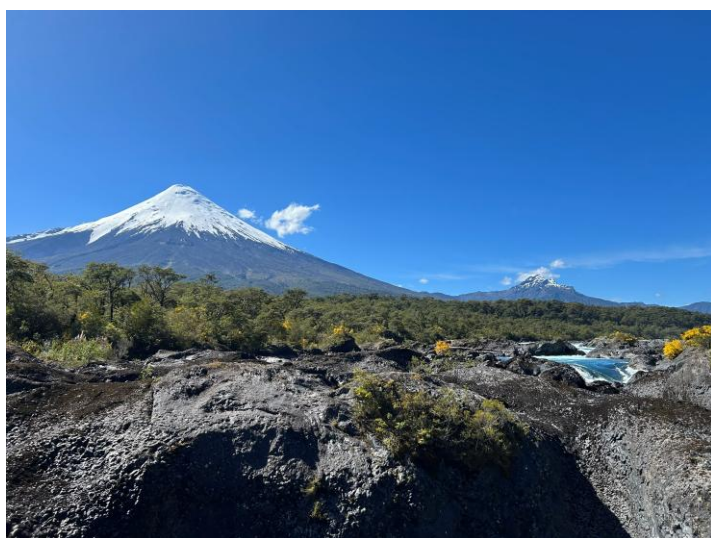
Der Vulkan Osorno in der Region Los Lagos ist einer der über 90 aktiven Vulkane in Chile.

Von Puerto Natales wollte ich eigentlich mit der Fähre vier Tage lang durch die Fjorde Patagoniens bis ins 1.800 Kilometer entfernte Puerto Montt in der Region Los Lagos fahren. Doch aufgrund heftiger Wetterbedingungen kann die Fahrt nicht wie geplant stattfinden. Damit bewahrheitet sich das patagonische Sprichwort: Wer sich beeilt, verschwendet seine Zeit. Getreu diesem Motto übe ich mich in Geduld und warte, bis die Fähre schließlich mehr als einen Tag später eintrifft. Die Vorfreude auf das Abenteuer ist groß: In den abgelegenen Fjordlandschaften leben weder Menschen, noch gibt es jeglichen Kontakt zur Außenwelt. Die Freude ist jedoch nur kurz: Am nächsten Morgen hat das Schiff immer noch nicht abgelegt.