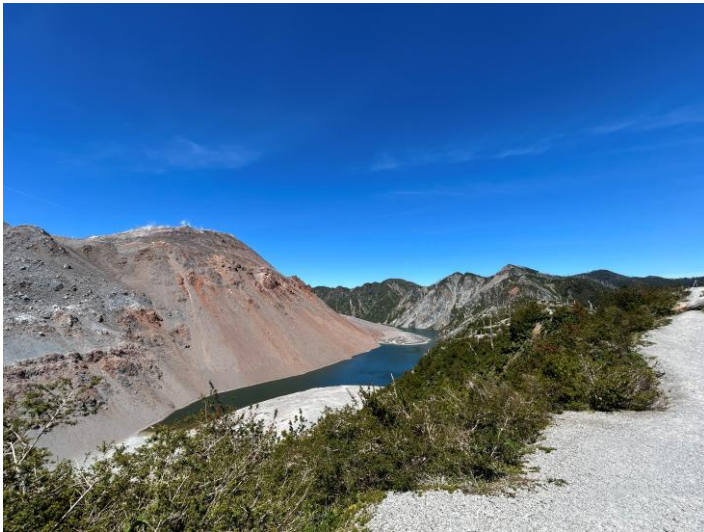
Der Vulkan Chaitén im Nationalpark Pumalín Douglas Tompkins ist 2008 ausgebrochen und hat den Park sowie anliegende Orte zerstört.