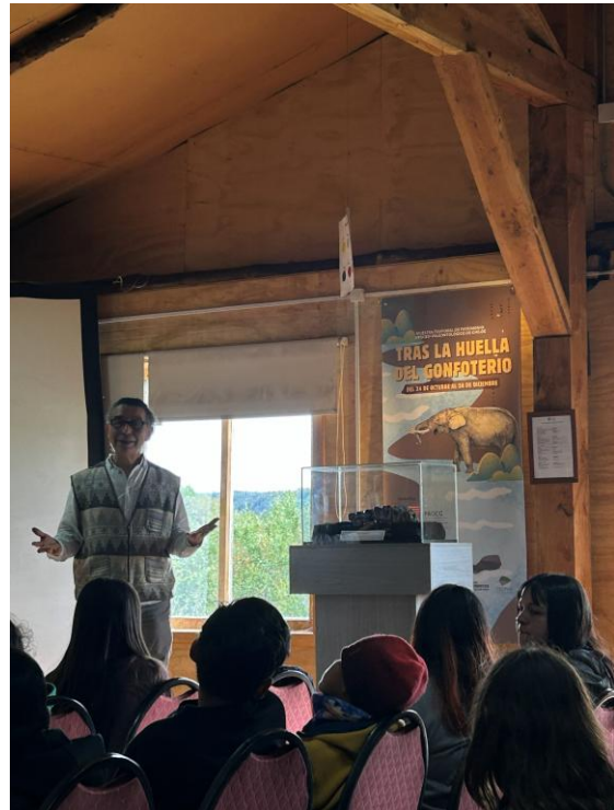
Im Bildungszentrum Wekimün Chilkatuwe lernen Kinder, die Kultur der Mapuche zu bewahren.