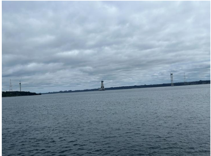
Der Bau der Chacao-Brücke schreitet voran.

Die Regierung preist die Brücke als Fortschritt an, doch viele Chiloten fühlen sich übergangen, weil sie in Entscheidungsprozesse kaum einbezogen wurden. Zudem bleiben viele Fragen zu ökologischen und sozialen Risiken offen: Die Brücke könnte die Ausbreitung invasiver Arten und Krankheiten sowie den Zugang zu den natürlichen Ressourcen der Insel erleichtern. Die NGO Chiloé Protegido warnt vor dem Verlust einheimischer Pflanzen- und Tierarten und der Zerstörung von Lebensräumen. Fast die Hälfte der Holzindustrie von Los Lagos