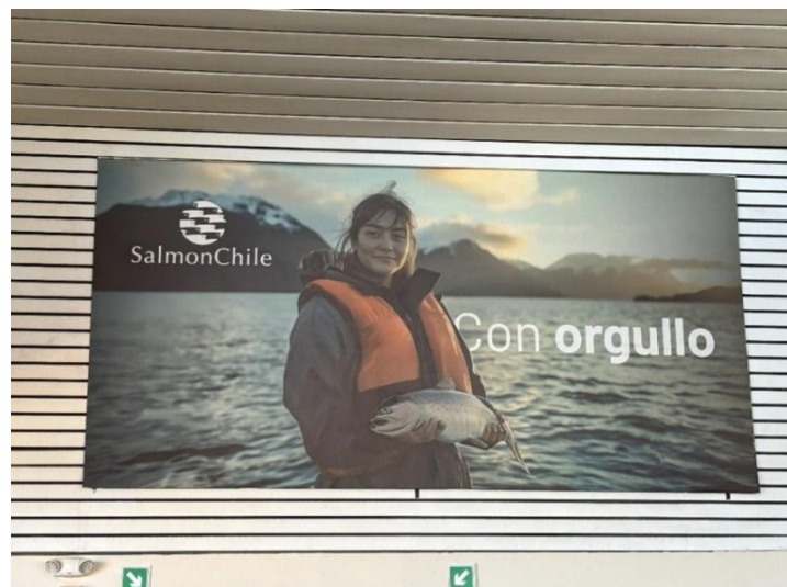
Lachs-Werbung an einem Flughafen in der Region Aysén.