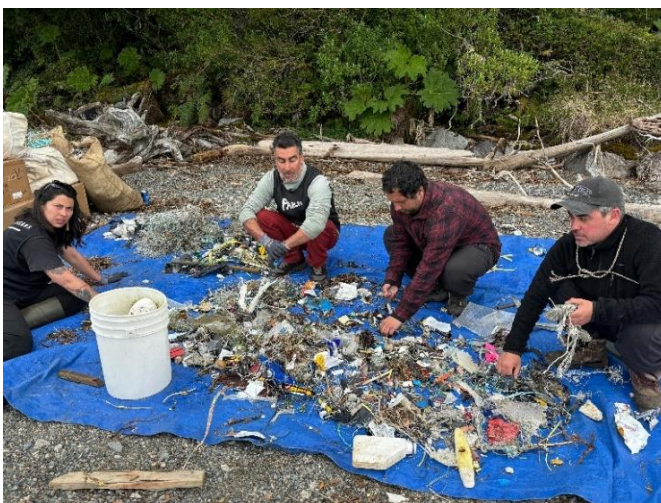
Freiwillige Helfer sammeln Müll am Ufer.

Touren zur Lagune an. „Wir haben zunächst die Umweltbehörden informiert, aber als nichts passierte, beschlossen wir: Wir machen es selbst“, erzählt Daniel. Beim ersten Einsatz sammelten die Helfer rund vier Kubikmeter Müll ein. Was als kleine Aufräumaktion begann,