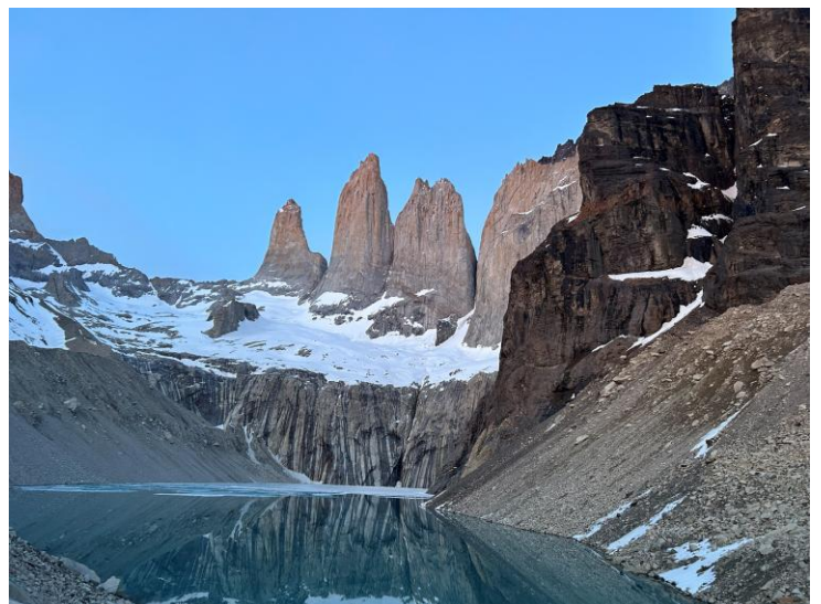
Unterwegs im Nationalpark Torres del Paine.

Doch der Boom hat auch Schattenseiten: Sensible Ökosysteme geraten unter Druck, Übernutzung, Müll, Waldbrände und ungewöhnliche Wetterereignisse bedingt durch den Klimawandel gefährden Natur und Besucher. „Als die Saison begann, gab es viel Regen, und in den Gebieten, die durch Brände betroffen waren, entsteht starke Erosion. Normalerweise kann die Natur das Wasser aufnehmen, aber durch die Erosion läuft das Wasser einfach ab, und Wanderwege werden überschwemmt. Solange das Parlament das Budget für die Schutzgebiete und deren Personal immer weiter kürzt, gibt es keinen ausreichenden Schutz“, erzählt Beatriz, die als Guide im Nationalpark Torres del Paine arbeitet. Oft reicht das Personal in den Nationalparks kaum aus, um die Besucherströme zu lenken, die riesigen Flächen zu überwachen und Notfallpläne anzupassen. Unfälle, wie der tragische Vorfall im November 2025 als fünf Touristen im Nationalpark Torres del Paine bei einem plötzlichen Schneesturm ums Leben kamen, zeigen, wie wichtig Vorsichtsmaßnahmen und Aufklärung sind.