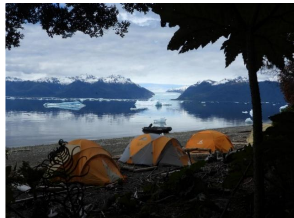
Die Helfer campen an der Lagune San Rafael.