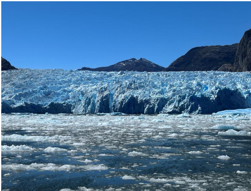
Im Nationalpark Laguna San Rafael lässt sich das Gletscherschmelzen deutlich beobachten.

Mit rund 26.000 Gletschern beherbergt Chile circa 80 Prozent aller Gletscher Südamerikas. Die beiden großen Eisfelder, Campo de Hielo Sur und Campo de Hielo Norte, in Patagonien bilden mit etwa 17.000 Quadratkilometern die drittgrößte zusammenhängende Eismasse der Welt, das Erbe vergangener Eiszeiten.